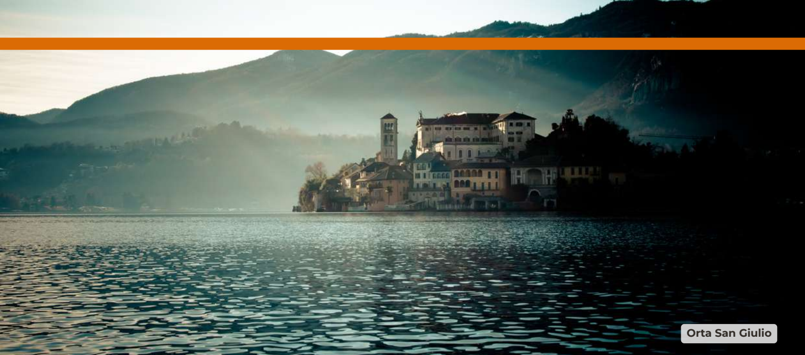
Orta San Giulio